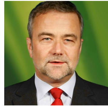
Jahrgang 1960 Vorstandsvorsitz im Bundesverband Mediation e.V. www.bmev.de