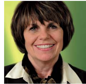
Jahrgang 1945 Gesellschafterin vom www.mit-institut.de

Mein WIE wird geleitet von meinen verschiedenen Qualifikationen: