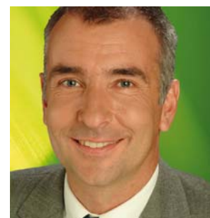
Jahrgang 1966 Freier Berater und Trainer