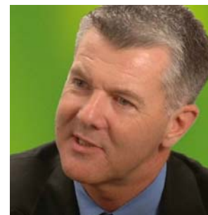
Coach & Trainer CoachingChanges.co.uk